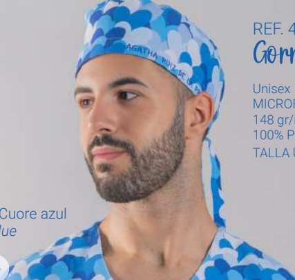
c/5146 Cuore azul Cuore blue

Unisex MICROFIBRA/MICROFIBRE 148 gr/m 2 100% PES TALLA ÚNICA/ONE SIZE