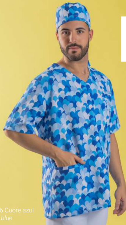
c/5146 Cuore azul Cuore blue