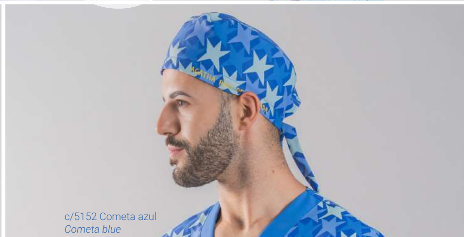
c/5152 Cometa azul Cometa blue

Con tejido absorbente para sudoración en el frontal interior.