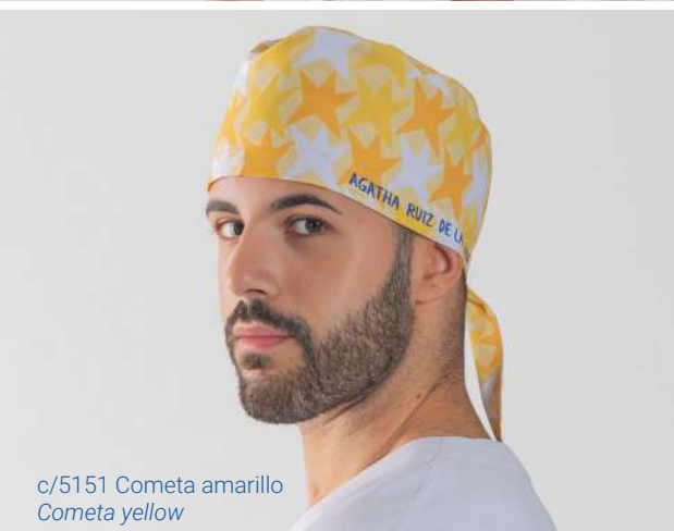
c/5151 Cometa amarillo Cometa yellow