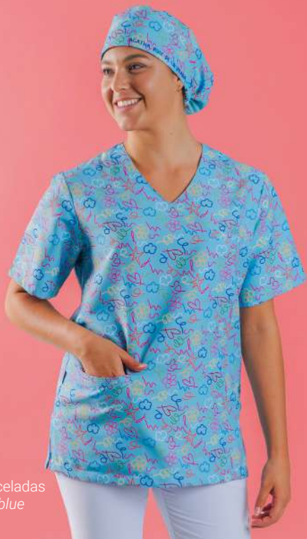
c/5153 Pinceladas Pinceladas blue