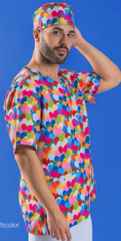
c/5149 Cuore multicolor