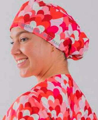
c/5147 Cuore rojo Cuore red

Unisex MICROFIBRA/MICROFIBRE 148 gr/m 2 100% PES TALLA ÚNICA/ONE SIZE