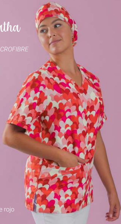
c/5147 Cuore rojo Cuore red

Unisex MICROFIBRA/MICROFIBRE 148 gr/m 2 100% PES XS-XXL