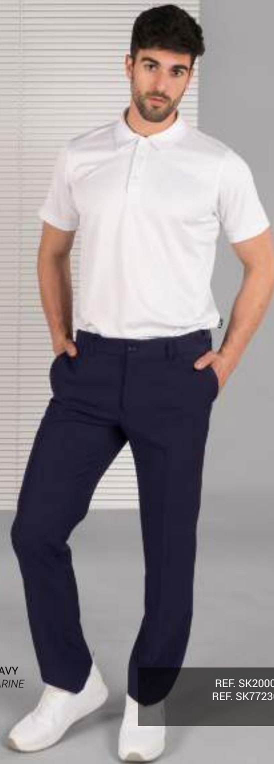
C/104 NAVY BLEU MARINE

REF. SK200051EC UOMO/HOMME (P. 9 CAT. SKECHERS) REF. SK77236EC DONNA/FEMME (P. 17 CAT. SKECHERS)