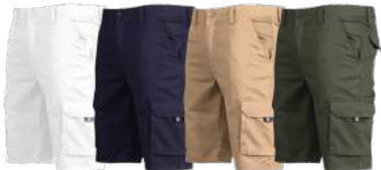
C/101 BIANCO BLANC