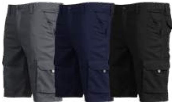
C/109 GRIGIO GRIS