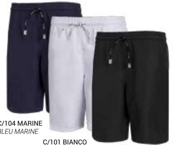
C/104 MARINE BLEU MARINE