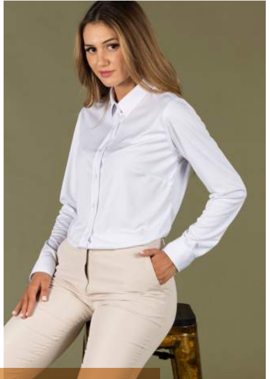
REF. 700027 PANTALONE CHINO UOMO/PANTALON CHINO HOMME (P. 33) REF. 700028 PANTALONE CHINO DONNA/PANTALON CHINO FEMME (P. 33)