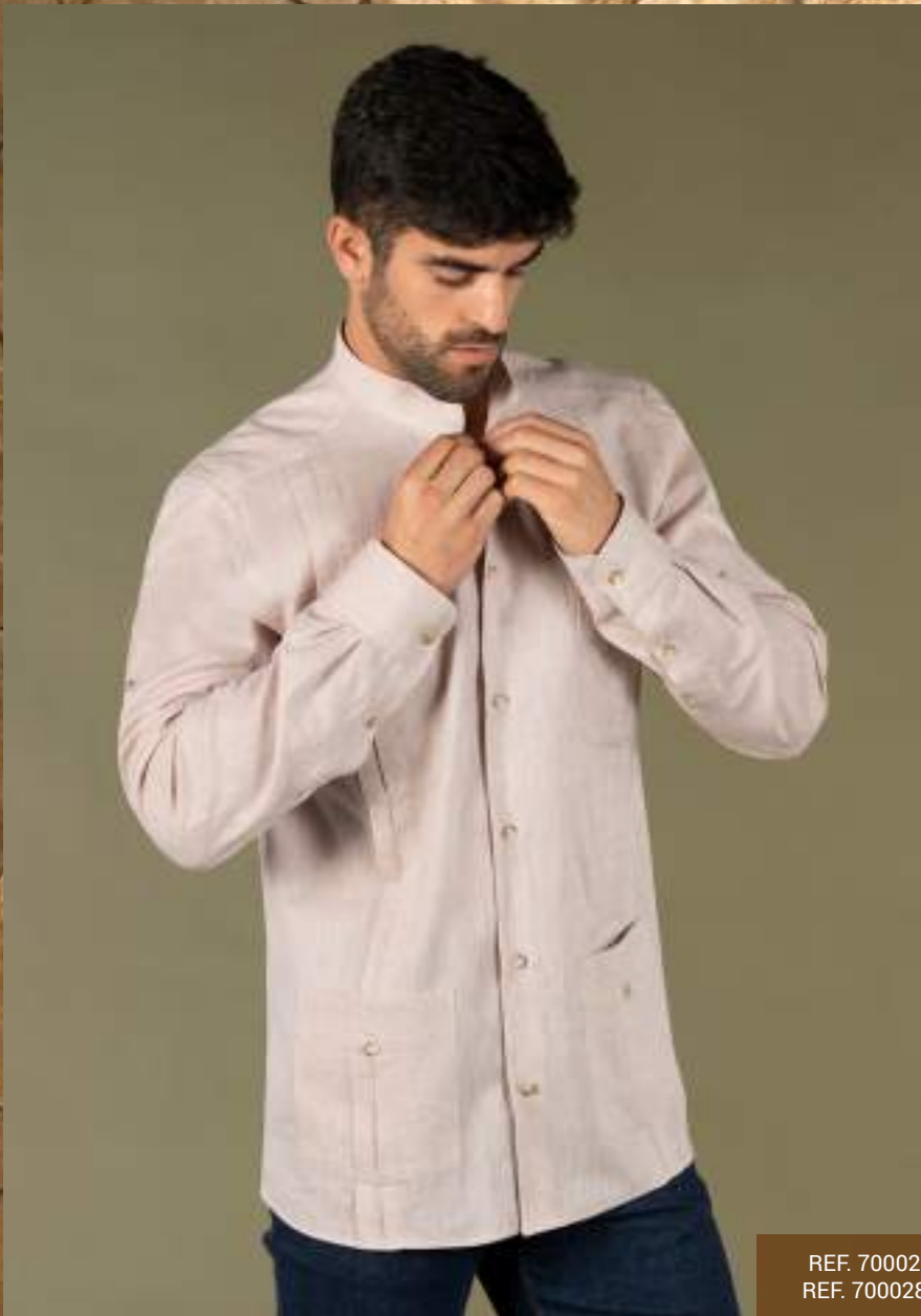
REF. 700027 PANTALONE CHINO UOMO/PANTALON CHINO HOMME (P. 33) REF. 700028 PANTALONE CHINO DONNA/PANTALON CHINO FEMME (P. 33)