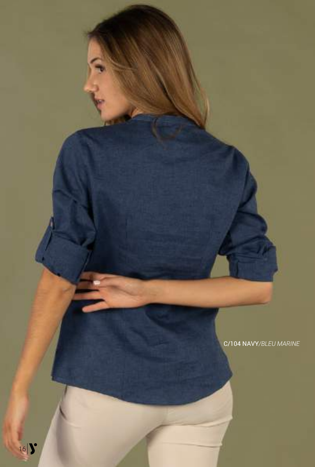
C/104 NAVY/BLEU MARINE