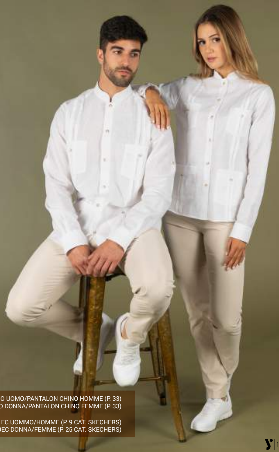
REF. SK200051EC UOMMO/HOMME (P. 9 CAT. SKECHERS) REF. SK77210EC DONNA/FEMME (P. 25 CAT. SKECHERS)