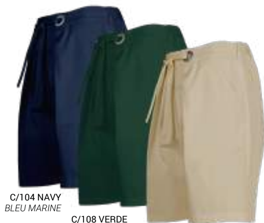
C/104 NAVY BLEU MARINE

REF. 700029 BERMUDA UOMO/BERMUDA HOMME TAGLIE/TAILLES 36-60 PIATTO/TESSAGE PLAT 158gr/m 2 100%PES