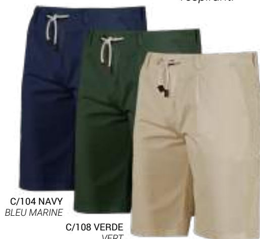
C/104 NAVY BLEU MARINE

Un tissu hydrofuges soumis à un traitement qui permet d'éviter l'humidité et les fuites, qui empêche l'absorption de l'humidité et les fuites, qui empêche l'absorption de l'eau et forme une couche en superficie qui lui permet d'être respirant.