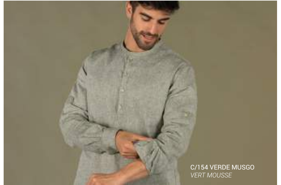
C/154 VERDE MUSGO VERT MOUSSE