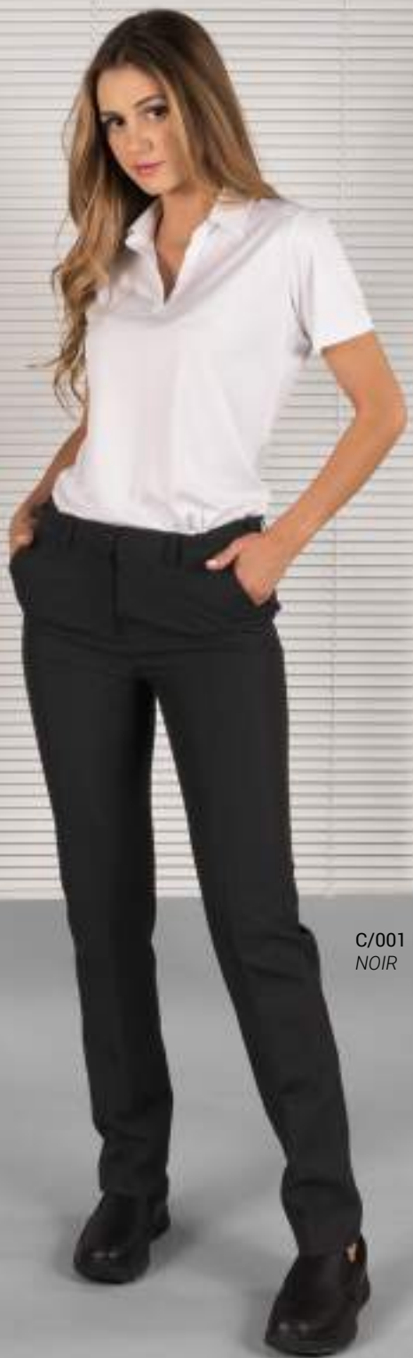
C/001 NERO NOIR